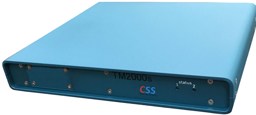
ネットワーク監視装置 TM2000s